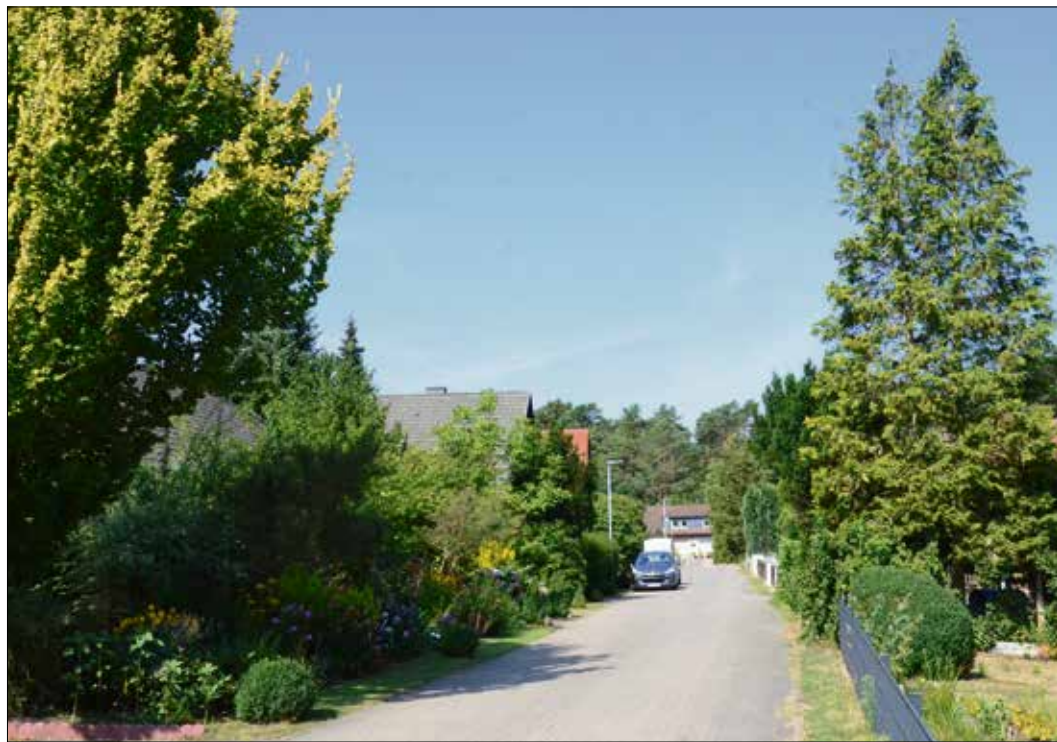
Für Grundstückseigentümer könnte es wegen der Straßenausbaubeiträge sehr teuer werden, wenn einmal die Sanierung einer Straße ansteht.

Der große Auftritt im Hermannsburger Heimatmuseum findet im Rahmen eines Besuchsprogramms der Gruppe statt. Der Eintritt ist frei, um Spenden wird gebeten.