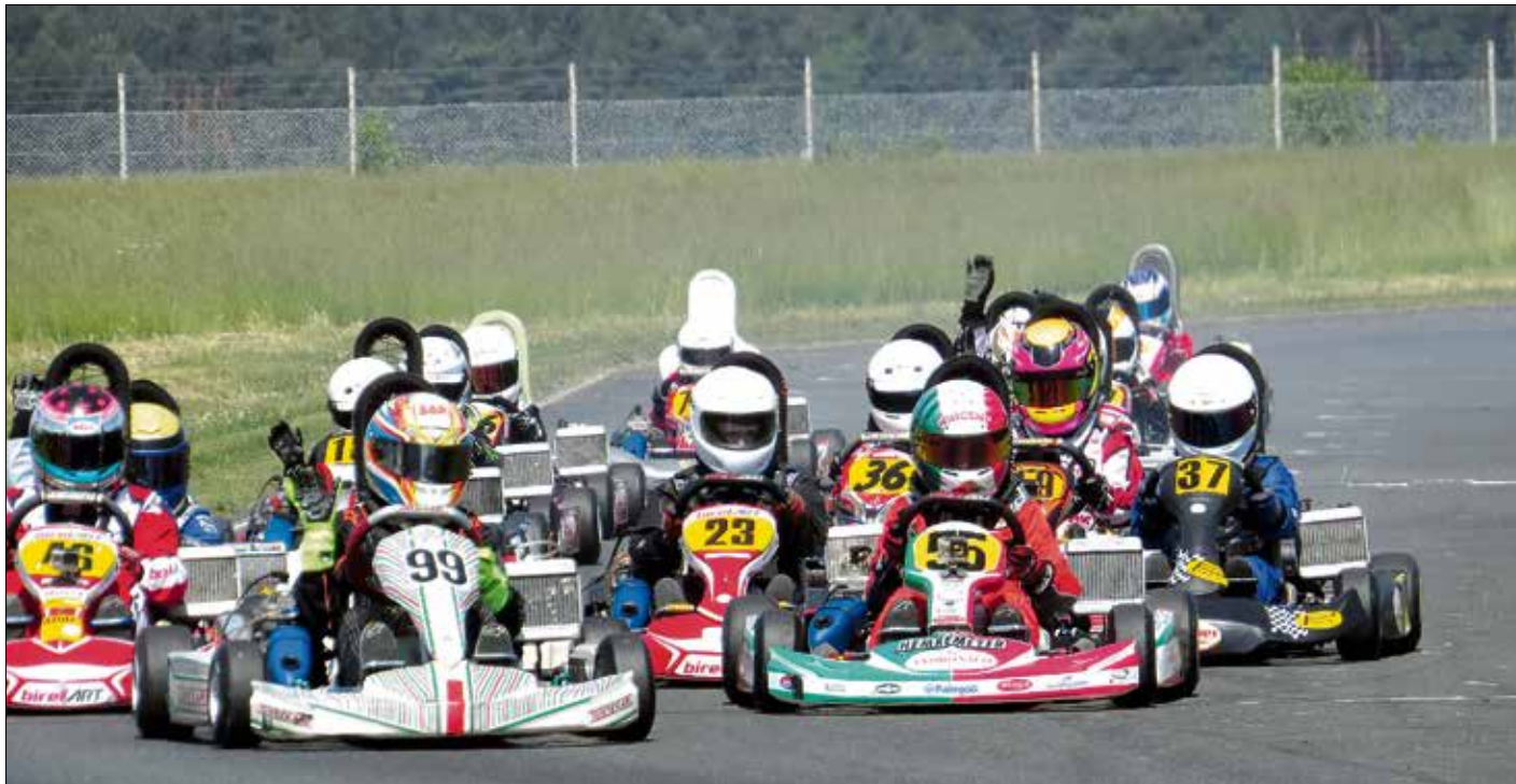
Der Faßberger ADAC-Ortsclub veranstaltet am 11. und 12. August sein 58. Kartrennen.