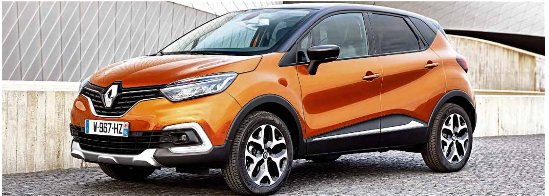
Der Renault Captur besitzt eine ausdrucksstarke Optik mit einem neu gezeichneten Kühlergrill.