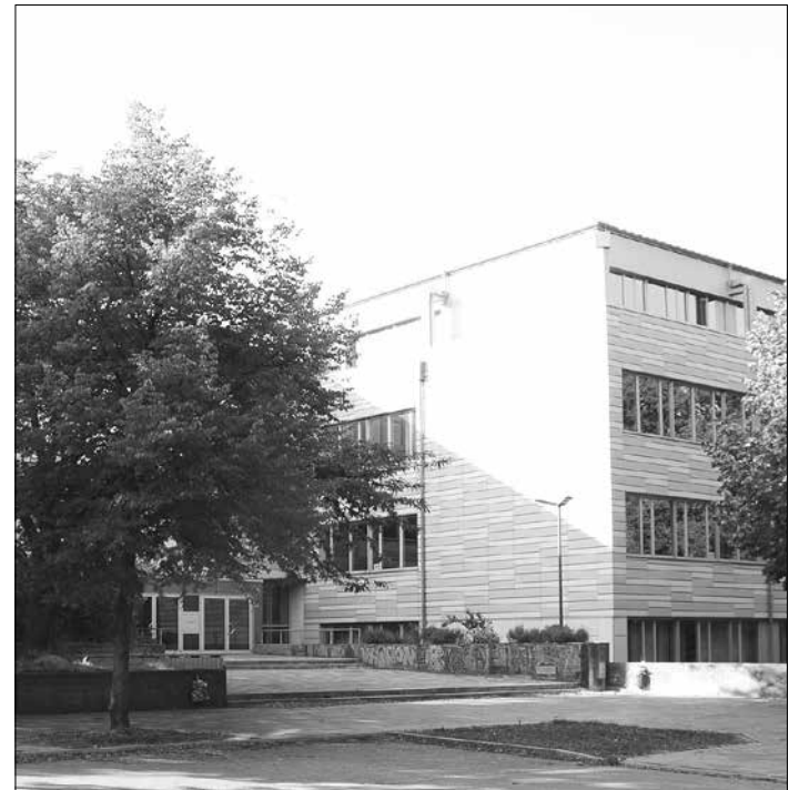
Im Hermann-Billing-Gymnasium werden Sanierungsmaßnahmen vorgenommen.

Die Sanierungs- und Wiederherstellungskosten werden sich auf 30.000 bis 40.000 Euro belaufen.