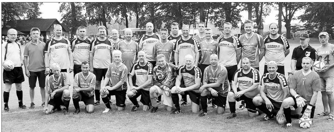
Beim so genannten Legendenspiel traten ehemalige Spieler vom TuS Eversen/Sülze an, wie zum Beispiel der heimische CDU-Bundestagsabgeordnete Henning Otte (hintere Reihe, Achter von rechts).