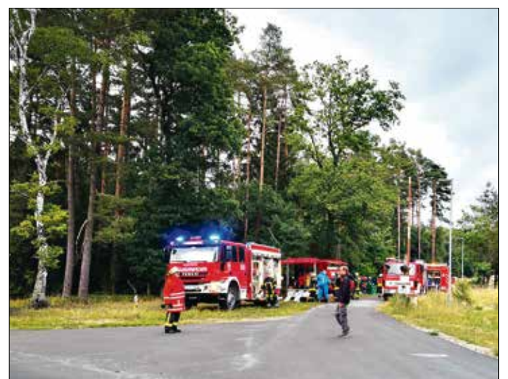
Die Feuerwehr Faßberg war im Einsatz.

Die Feuerwehr und der Rettungsdienst Marquardt waren mit insgesamt 78 Einsatzkräften und 17 Fahrzeugen vor Ort. Nach zirka zwei Stunden war der Einsatz beendet.