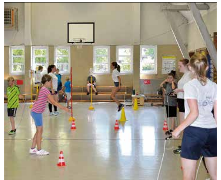
Die Kinder hatten viel Spaß beim Rope Skipping.