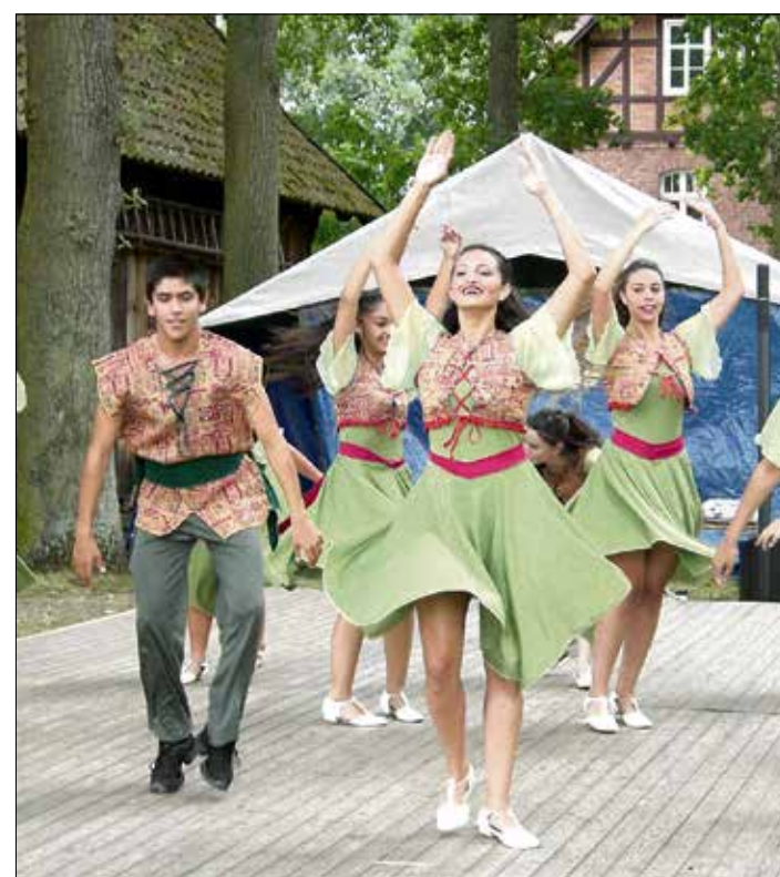
Die israelische Jugendtanzgruppe zeigt ihr Können und präsentiert ein künstlerisches Bewegungsprogramm.

Gasser kritisiert, dass auf Landesebene die SPD andere Prioritäten habe. Seiner Meinung nach müsse der Druck so lange aufrechterhalten bleiben bis die nächste Wahl komme, denn die Abschaffung in Bayern sei ganz klar ein Produkt der Wahl gewesen. „Vielleicht schaffen wir das Niedersachsen auf diese Art und Weise auch“, erklärt er. „Es werden ständig Gespräche mit den Parteien geführt. Man muss laufend am Ball bleiben.“ Und auch auf Kreisebene will der Verband Wohneigentum das Thema weiter vorantreiben. (ram)