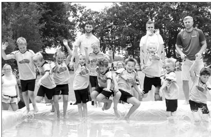
Endlich Abkühlung: Die E-Jugend des TuS Eversen/Sülze beim Sprung in den auf dem Sportplatz aufgebauten „Pool“.

dadurch würde bei uns viel gesellschaftliches Miteinander für Jung und Alt verloren gehen.“