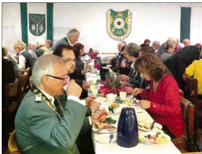
Ein Höhepunkt des Festes ist das Bürgerfrühstück.

ihren Königsschuss ab. Der Samstag, 11. August, ist der traditionelle Tag der neuen Majestäten. Ab 14 Uhr ist Kindernachmittag. Um 15 Uhr beginnt der Kommerz der Schützen mit geladenen Gästen im Schützenheim und Festessen.